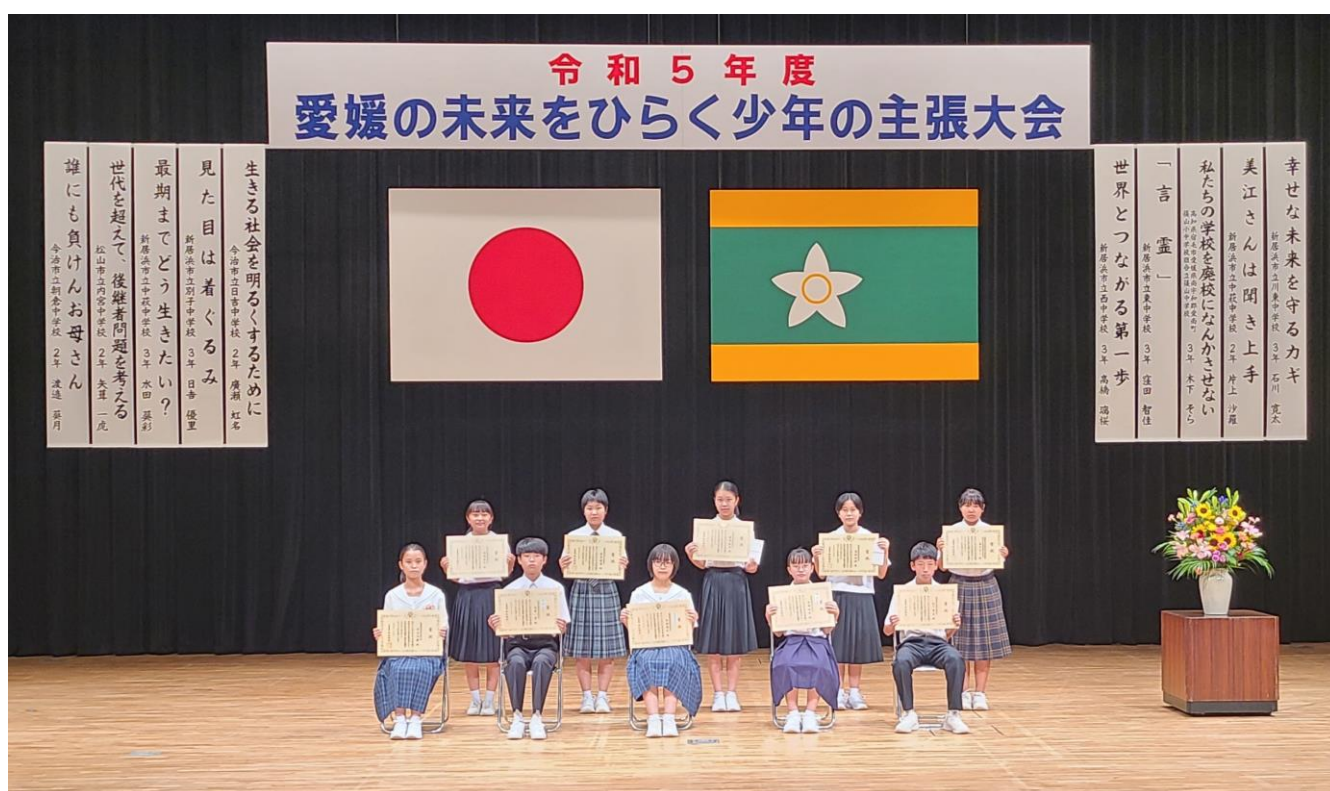
令和5年度「愛媛の未来をひらく少年の主張大会」(令和5年8月5日)